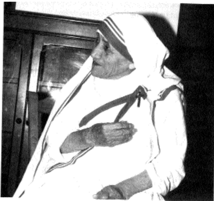
Всемирно известная албанка - Мать Тереза, рождённая Agnes Gonxhe Bojaxhi.